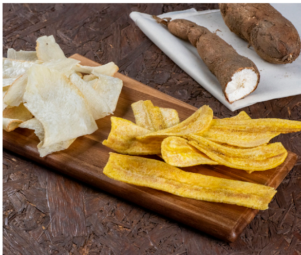
03 Produtos tropicais