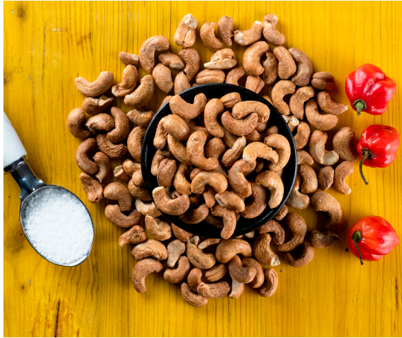
01 Castanha de cajú