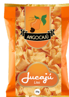
Jucajù Liso - 20g

Ingredientes: Lâmina de jucajù, óleo vegetal, fécula de mandioca e Sabor.