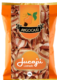
Jucajù Listrado - 20g

Ingredientes: Farinha de trigo enriquecida com ferro e ácido fólico, fécula de mandioca, sal refinado e bicarbonato de sódio.