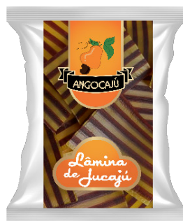
Lâminas de Jucajù Listrado - 100g

Ingredientes: Farinha de trigo enriquecida com ferro e ácido fólico, fécula de mandioca, sal refinado e bicarbonato de sódio.