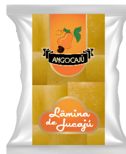
Lâminas de Jucajù Liso - 100g

Ingredientes: Farinha de trigo enriquecida com ferro e ácido fólico, fécula de mandioca, sal refinado e bicarbonato de sódio.