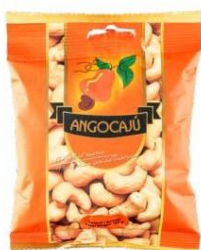
Noix de Cajou Naturelles - 100g

Ingrédients : Noix de cajou, huile végétale.