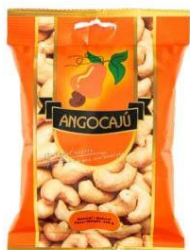
Noix de Cajou Naturelles - 200g

Unités par boîte : petites boîtes : 24 paquets, grandes boîtes : 66 paquets.