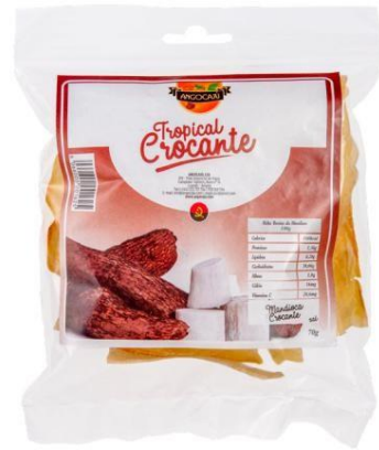
Manioc croustillant 70g

Unités par boîte : petites boîtes : 24 paquets (70g) grandes boîtes : 42 paquets (70g).