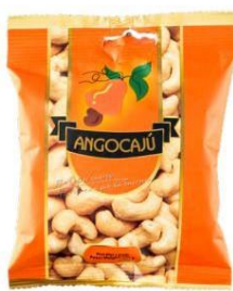
Noix de cajou au piri-iri -100g

Ingrédients : Noix de cajou, huile végétale, piment.