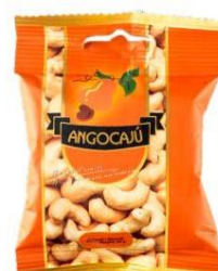
Noix de Cajou Naturelles - 30g

Ingrédients : Noix de cajou, huile végétale.