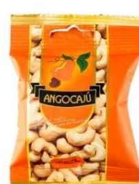
Noix de cajou au piri-iri - 30g

Ingrédients : Noix de cajou, huile végétale, piment.