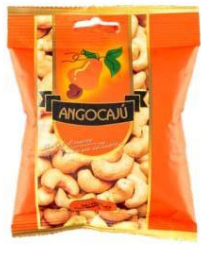
Noix de cajou au sel - 100g

Ingrédients : Noix de cajou, huile végétale et sel.