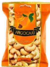
Noix de cajou au sel - 200g

Ingrédients : Noix de cajou, huile végétale, piment.