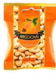
Noix de cajou au sel - 30g

Ingrédients : Noix de cajou, huile végétale et sel.