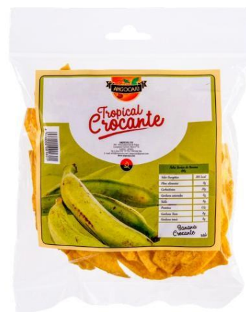
Banane croustillante 70g

Ingrédients : Manioc, huile végétale et sel.