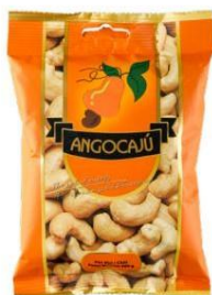
Noix de cajou au piri-iri - 200g

Ingrédients : Noix de cajou, huile végétale.